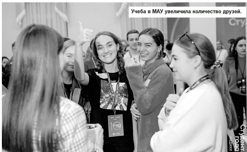
Учеба в МАУ увеличила количество друзей.