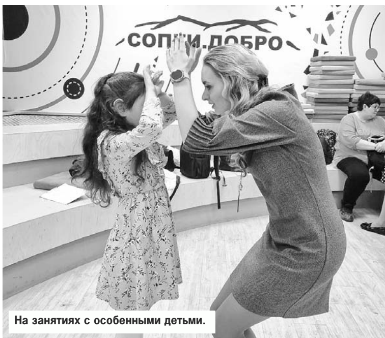
На занятиях с особыми детьми.