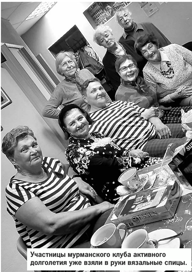
Участницы мурманского клуба активного долголетия уже взяли в руки вязальные спицы.

Несмотря на то, что многим мурманским волонтерам серебряного возраста и самим время от времени необходима забота и помощь, все они точно знают, что могут помочь и другим. Проект, в котором объединились добровольцы из мурманского социального центра «Рука помощи» и клуба активного долголетия, так и называется – «Все в ваших руках». Участницы проекта ухаживают за тяжелобольными людьми, моют окна и убирают квартиры у тех, кому это сделать уже не позволяет здоровье, да и попросту навещают одиноких горожан, устраивают чаепития с пирогами, поют песни, а то и станцуют! Мурманские активистки они такие. Говорят, что их неравнодушная душа и не стареет, и не черствеет. После того, как «Вечерка» рассказала, что клуб активного долголетия устраивает показ мод с костюмами для фитнеса и индийскими нарядами, здесь не было отбоя от телефонных звонков: немало мурманчанок элегантного