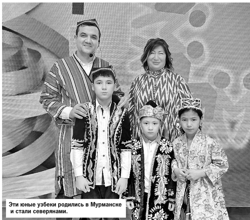
Эти юные узбеки родились в Мурманске и стали северянами.